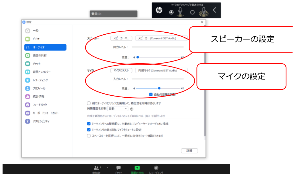
図5：スピーカーおよびマイクの設定