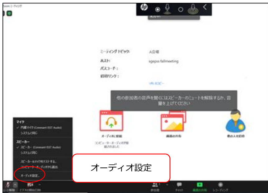
図4：オーディオ設定

マイクのアイコン右側の「^」をクリックし、「オーディオ設定」から、スピーカーの設定およびマイクの設定を確認して下さい（図4・図5）。