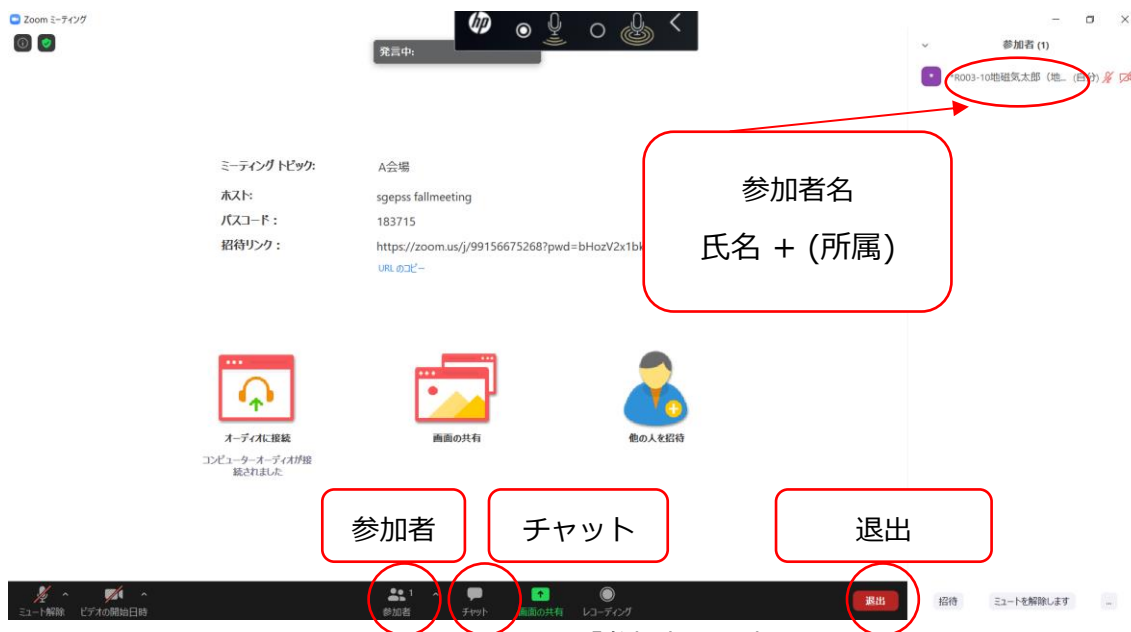
図 2 : Zoom の「参加者」設定

セッション開始時刻の3分前に、座長から聴講者へ、操作の説明(質問方法など)を行います。